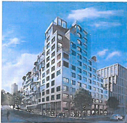
Rosny-sous-Bois. Voilà à quoi pourrait ressembler le futur écoquartier. Le bâtiment de 12 étages sera en béton et en bois. Les premières livraisons sont prévues en 2021

commerces de proximité, d'une crèche et d'une école flamboyante, avec vingt et une classes. « Tout n'est pas négatif, mais c'est trop haut », râle cet habitant, voisin des futurs immeubles. Martine, 59 ans, critique aussi cette « densité déconcertante ». « Il faut arrêter avec ses grandes barres », s'emporte-t-elle. « Nous ne pouvions pas faire des bâtiments de six ou sept étages, sinon nous aurions dû bétonner partout », souligne l'élue. Face au maire, micro à la main, cet autre riverain regrette « le manque de rondeur » des futurs édifices. « Je les trouve un peu agressifs, développe-t-il. Mais avec le métro et les commerces, par rapport à ce qu'il y avait avant, c'est extraordinaire ! » De quoi faire lâcher un sourire à Claude Capillon : « Avant, il n'y avait rien, donc ça ne peut être que mieux. »